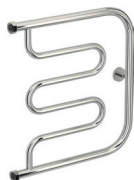
«Лира+» (с полками и без)