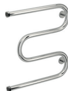
«М-образный+» (с полками и без)